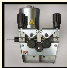
TRAINAFILO A 4 RULLI INGRANATI D. 30 WIRE FEEDER WITH 4 GEARED ROLLERS D. 30