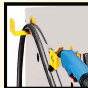
PORTA TORCIA TORCH HOLDER

*D-mig 735 LAB Accessori in dotazione - Supplied accessories